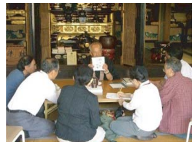
■ 第2回(平成18年10月19日)大宮班