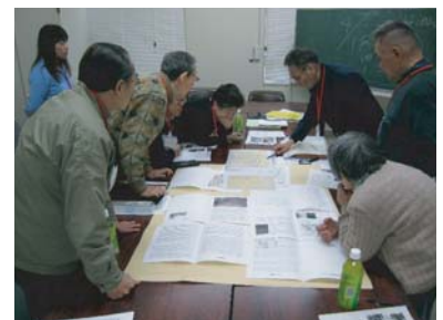
■ 第7回(平成19年3月26日)古市班