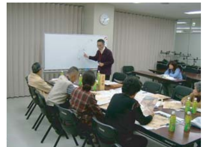
■ 第3回(平成18年11月20日)古市班