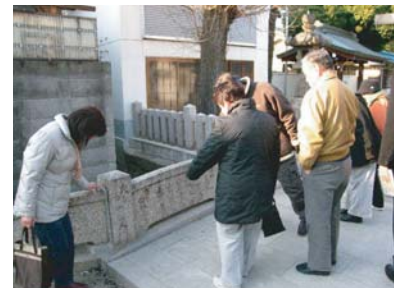
■ 第4回(平成19年1月15日)大宮班