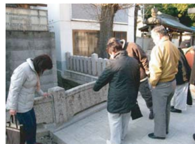
■ 第4回(平成19年1月15日)大宮班