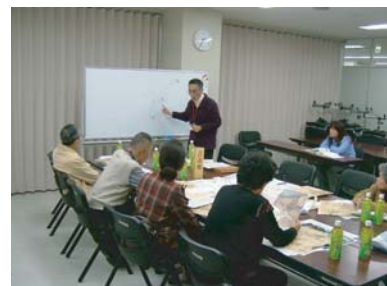
■ 第3回(平成18年11月20日)古市班