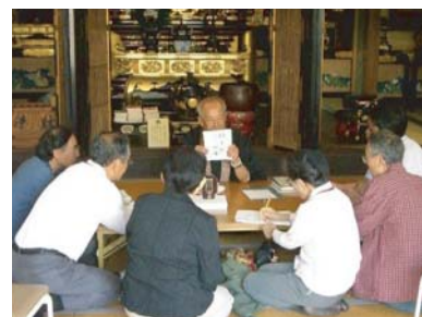
■ 第2回(平成18年10月19日)大宮班