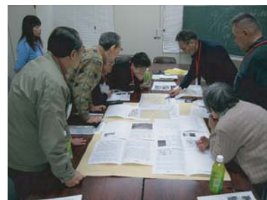
■ 第7回(平成19年3月26日)古市班