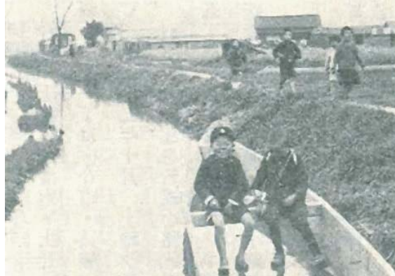
■三まいた(三枚板) 上)「城東区50年のあゆみ」より 下)旭区史より