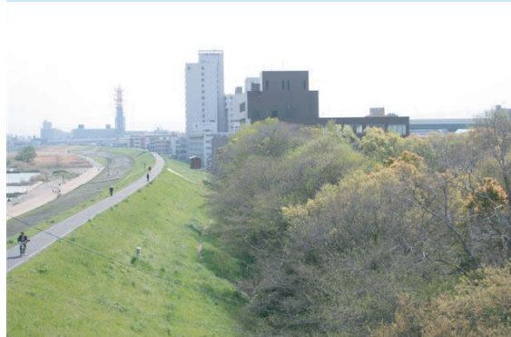
■淀川付近ではナシ畑やブドウ畑が広がっていた