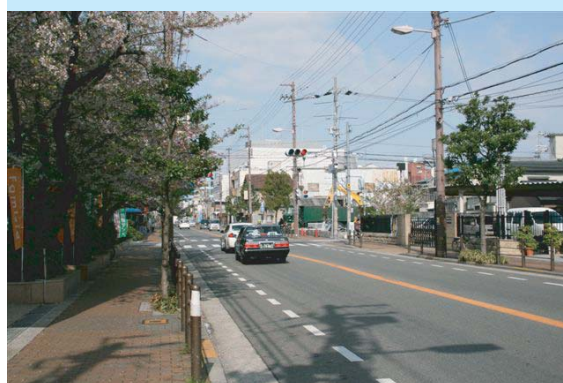
■柳通り一带にはネギ畑が広がっていた