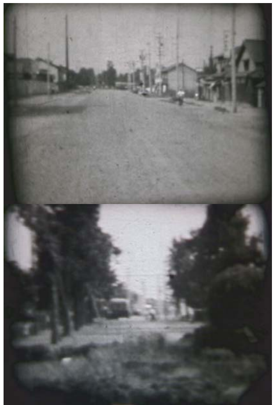
遠方に市電の姿が見える城北筋の風景(昭和32年(1957年)頃) 上)現在の中宮三丁目辺りから北を見る 下)現在の城北公園付近から南を見る