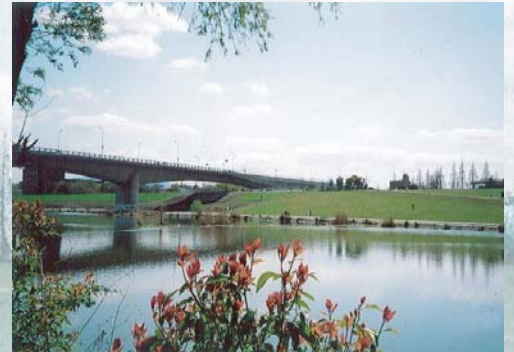
■ ワンドと菅原城北大橋