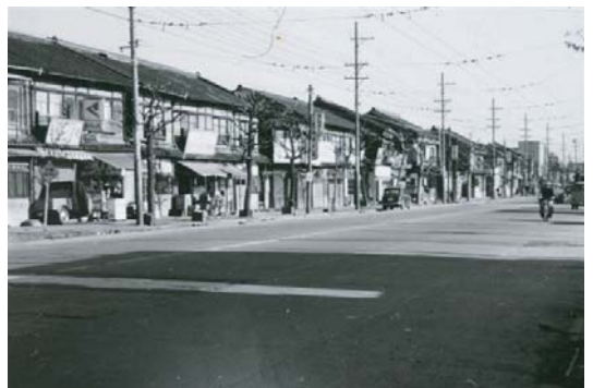
昭和32年(1957年)頃の国道1号