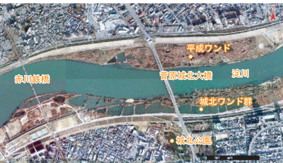
■ 淀川のワンドとその周辺

明治時代、船が安全に往来できるように「ケレップ水制」(水の流れを制御するための構造物)という工事が行われた。しかし、時代とともに船の利用が減り、整備されなくなった水制に土砂が堆積し、本流と隔離され、小さな池が連なって「ワンド」という独特の地形ができた。自然に根付いたヨシなどに囲まれた、生物にとっては貴重な憩いの場となっている。また、淀川水系ではすでに絶滅したと思われていたイタセンパラが発見され、国の天然記念物に指定された。