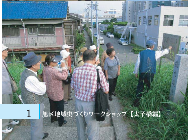
■ 第4回(平成19年10月4日) 太子橋フィールドワーク