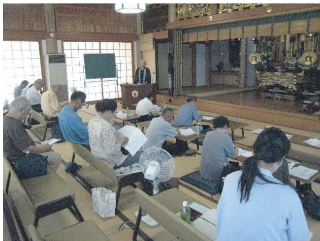
■ 第3回(平成19年9月7日) 重誓寺