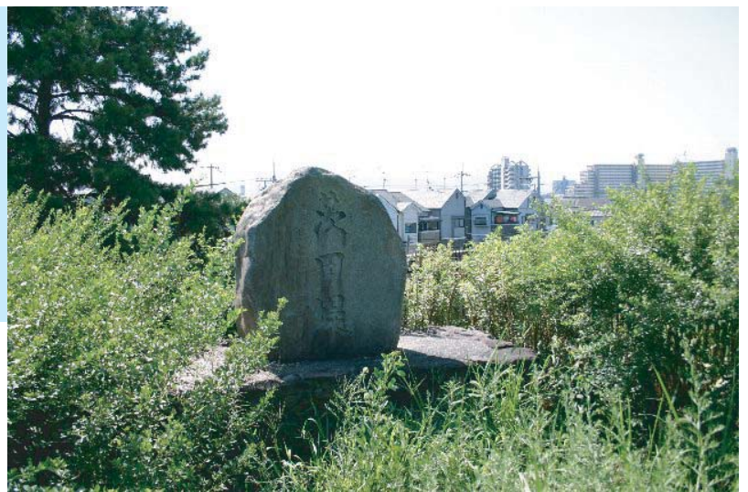
■ 淀川河川敷に設置された 茨田の堤の碑

大正十四年の地図（図②）を見るとそのことがよく判る。この頃は工事完了後間もない時期であるので旧河川が地図上によく残っている。もともと淀川の右岸にあった、豊里村、平田地区が左岸に取り残され、川全体が北へ大きく移動したことが読みとれる。