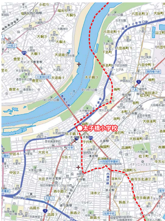
■ 図③ 最近の地形図

図中「—」が国境標示である。 川は北へ動いたけれど境界はそのまま残されたのである。 最近の地図(図③)を見ると大阪旭区太子橋が細長く 守口市域に入り込んでいるのはこのためである。 百年前、小学校の敷地はまさに川の真中にあったこと になる。近くの私の家もそのとおりである。 したがって改修後は飛地となった地区の住民は平太の 渡しを利用して通行した。 氏神様も豊里大宮へお参りするのが当然のことだった。