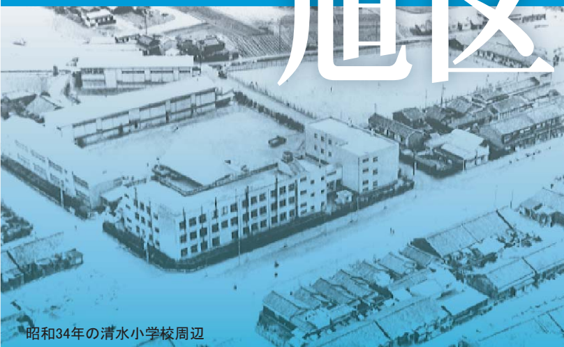
昭和34年の清水小学校周辺