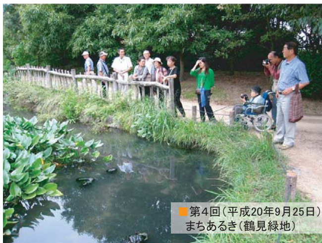
■ 第4回(平成20年9月25日) まちあるき(鶴見緑地)