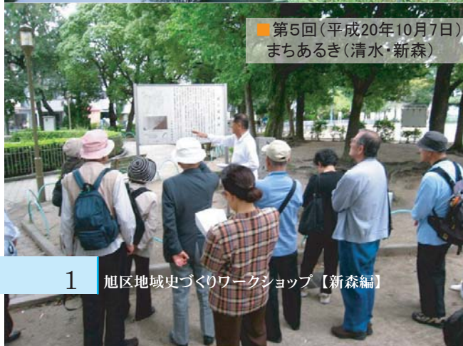
■ 第5回(平成20年10月7日) まちあるき(清水・新森)