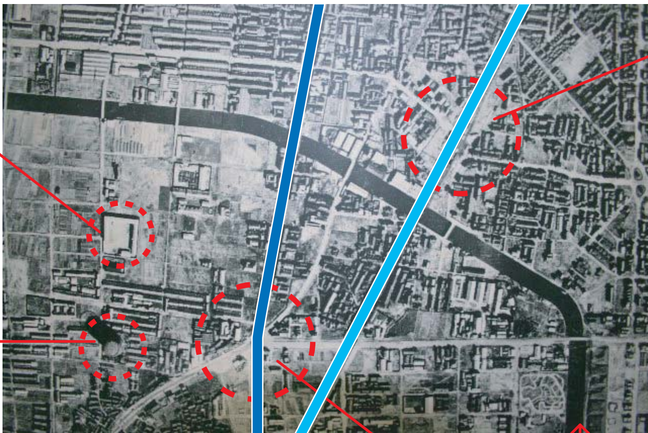
■旭区南部の航空写真(昭和17年頃)