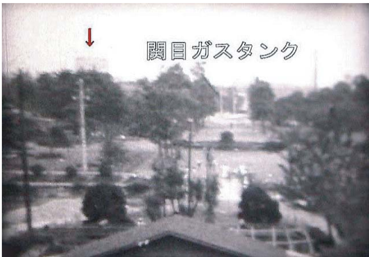
■城北公園から見るガスタンク

◆大阪空襲の時の1トン爆弾が高殿2丁目5(城北菅原道)で電気工事の時発見され撤去された。〈遠藤〉