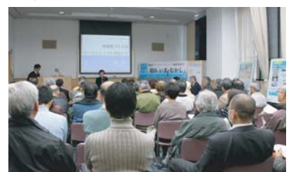
■成果発表会(平成22年2月27日)