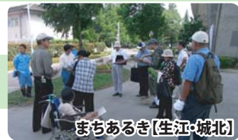
まちあるき(生江・城北)