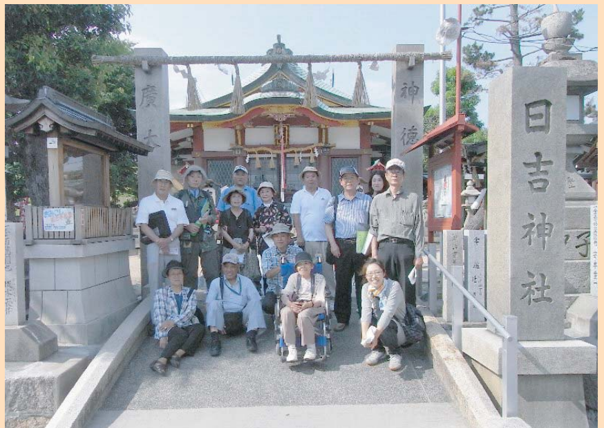
■ 日吉神社でのスナップ(平成21年6月24日の「まちあるき」にて)