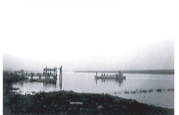
■平田の渡し[注4] (写真:旭区ホームページ)

この写真は、昭和45年3月3日「平太の渡し」廃止の日の写真です。豊里大橋の完成により淀川に最後まで残っていた渡し船がなくなりました。(旭区ホームページより)