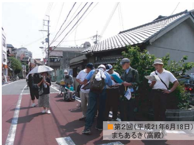
■第2回(平成21年6月18日) まちあるき(高殿)