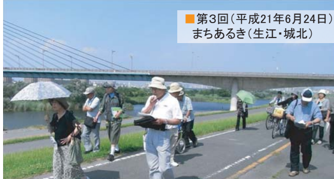
■第3回(平成21年6月24日) まちあるき(生江・城北)