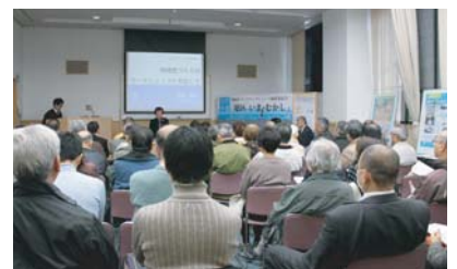
■成果発表会(平成22年2月27日)