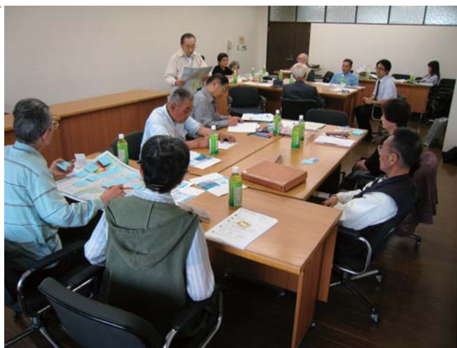
●ワークショップの様子

2年目の初日となる今回のワークショップでは、新しい参加者の方に地域史を制作した参加者自らがガイドを行い、昨年度の取り組み内容を紹介しました。そして、仮のグループ分けを行い、中宮及び太子橋について、知っていること、知りたいことを出し合いました。