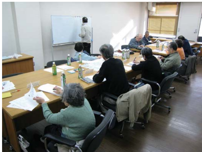
●ワークショップの様子

また、戦時中の空襲について、その当時の状況なども話し合いました。旭区は、約3割強が空襲によって焼けたそうです。歴史を記した文献、史実とともに、実際に体験された状況などは、後世に地域の歴史を伝えていく上で重要な意見・コメントになります。