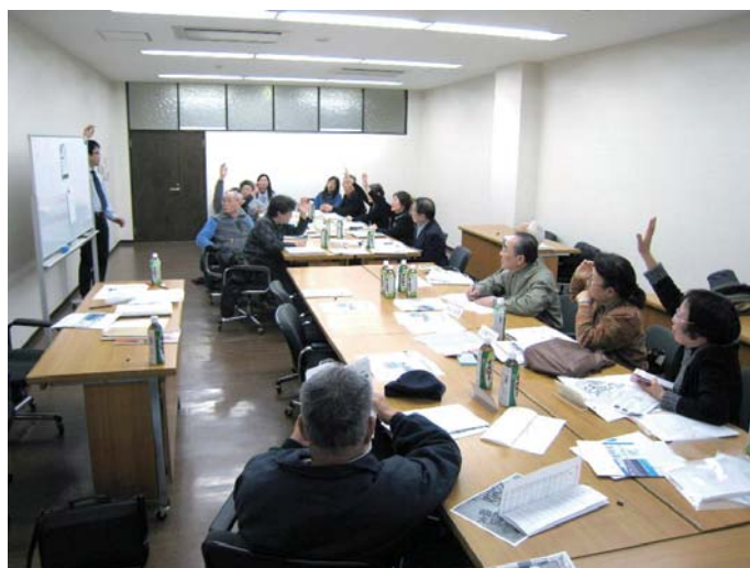
●ワークショップの様子