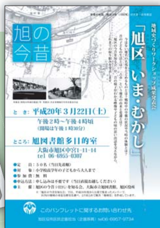
右)大人向けの案内リーフレット