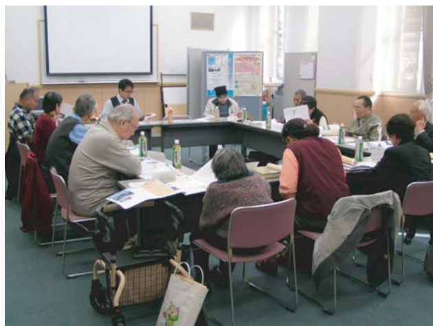
●ワークショップの様子