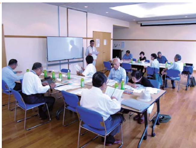
●ワークショップの様子

2回目となる本ワークショップでは、はじめに古地図の読み方や大川尻をはじめとした旭区の歴史にまつわる事柄等について、参加者に説明をしていただきました。そして、前回のワークショップでまとめたテーマについて再度議論を行った後、調べてみたいテーマのアンケートを行いました(下記ご参照)。それぞれは歴史的な関わりがあるため、テーマを限定せず地域史づくりを進めていくことになりました。