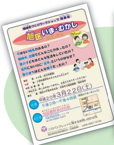
左)小学生向けの案内リーフレット