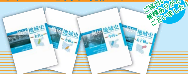
ご協力いただいた皆様ありがとうございました！