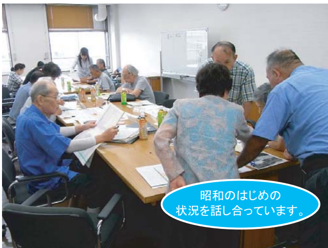
昭和のはじめの状況を話し合っています。