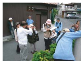
まちあるき【清水・新森】