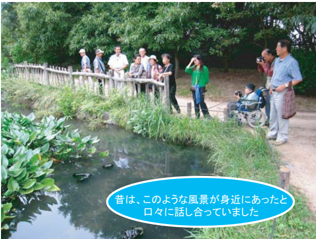
昔は、このような風景が身近にあったと口々に話し合っていました

4回目となる本ワークショップでは、清水・新森の昔日の様子を把握することを目的として、鶴見緑地内の施設を見学するフィールドワークを行いました。