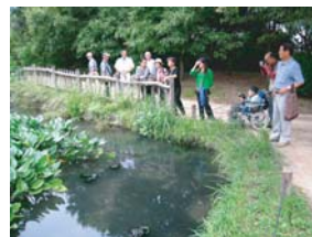
まちあるき【鶴見緑地】