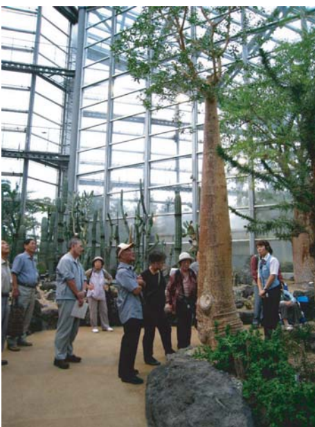
●咲くやこの花館(フラワーツアー)

このコースや見学場所は参加者の方が企画したもので、企画とともにそれぞれの施設の調整なども行っていただきました。