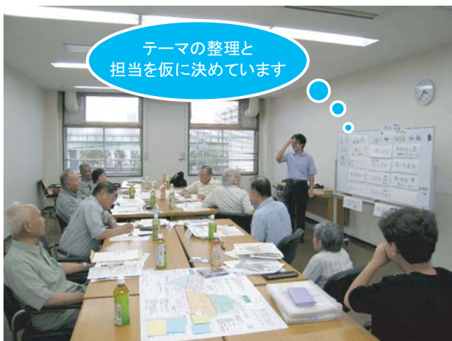
●ワークショップの様子

3回目となる本ワークショップでは、3つの地域で優先とすべきテーマを出し合うとともに、テーマを見つけるフィールドワーク(まちあるき)の企画について意見交換を行いました。