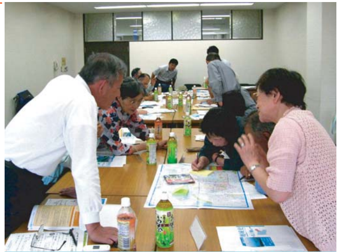
●ワークショップの様子

3年目の初日となる今回のワークショップでは、地域史づくりの内容とともに、3月に開催した発表会の感想、そして地域史の広報活動をどのように進めていくかなどの意見交換を行いました。広報については、本年度も昨年度と同じように発表会などを開催し、旭区の歴史や会の活動を広く知らせていくことになりました。