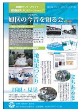
会の簡単な資料をつくりました。

また、地域史の作成を通じて、これまで積み重ねてきた経験等を活かした人材の育成、コミュニティのさらなる向上を目指しています。