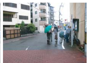
まちあるき【高殿南】