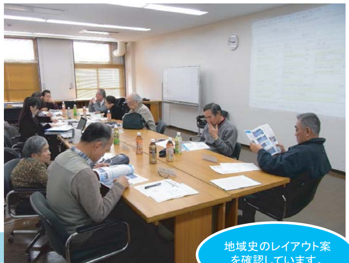
地域史のレイアウト案を確認しています。