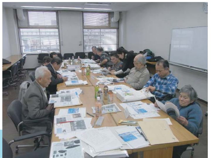
●ワークショップの様子

そして、成果発表会のプログラムや当日に配布をする資料構成などについて、最終調整を行いました。