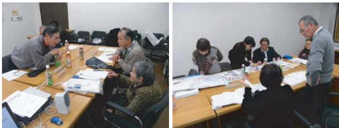
●ワークショップの様子

9回目となる本ワークショップでは、地域史のレイアウト案を確認をするとともに、前回と同様に掲載する記事の整理と、3月に予定している成果発表会のプログラムなどを話し合いました。