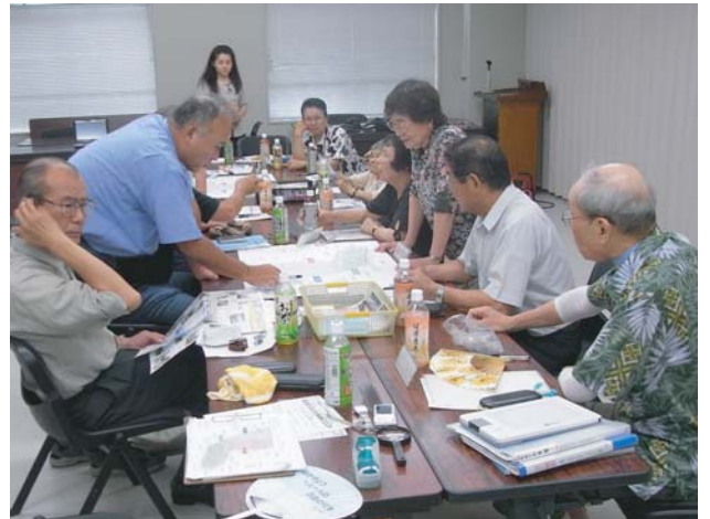
●ワークショップの様子