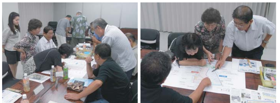
●地域史に掲載するキーワードについて話し合っています