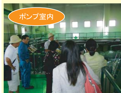
7台のポンプにより、1分間にプール3杯分の水を排水することができます。

この施設は、大雨の時に雨水が街に溢れないように城北川に雨水を流すなどの機能を持っています。