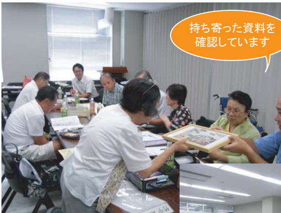
持ち寄った資料を確認しています