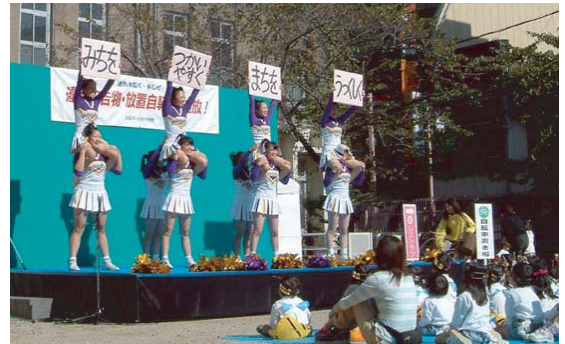
パトロール応援チアリーディングパフォーマンス