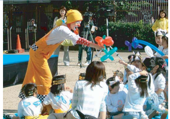
アトラクション「ままれのバルーンパフォーマンス」